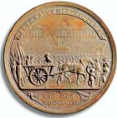
Französische Revolution, 1789-1799 Hinrichtung der Königin Marie Antoinette Medaille 1793 Die Königin wird im Leiterwagen zum Schafott gefahren.