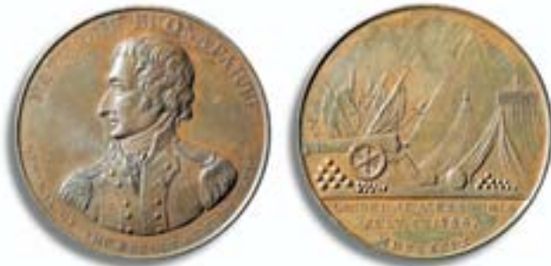
Englische Medaille 1799 auf die Landung Napoleons in Ägypten im Juli 1798

Die überlegene Armee machte auf ihrer Seefahrt erst gar kein langes Federlesen mit dem geistlichen Staat der Malteser-Ritter. Säkularisation gehörte zu den er-