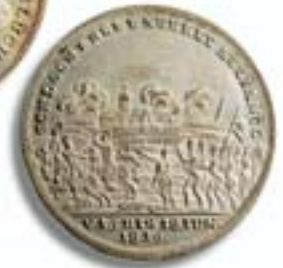
Medaille 1815 auf die Niederlage Napoleons in der Schlacht bei Waterloo Vs.: Blücher und Wellington, Rs.: Schlacht bei La Belle Alliance d.18. Juni 1815.