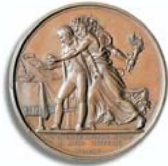
Die erste Abdankung, 1814, vor der Deputation nach Elba Medaille 1814.

herauszukommen. Seine Gegner zeigten sich großzügig, sie beließen ihm den Kaisertitel. Nach einer Friedenskonferenz erfolgte dann jedoch im Mai 1814 die Verbannung auf die kleine Mittelmeerinsel Elba, wo er sich als Landesfürst mit 700 Freiwilligen der alten Garde um die Angelegenheiten seines Kleinstaates kümmerte, stets in Verbindung zu seinen Angehörigen und Anhängern, die nur auf seine Wiederkehr hofften. Der Verlauf des Wiener Kongresses unter Fürst Metternich und die erneute Spaltung Europas in Interessengruppen veranlassten Napoleon im Februar 1815 zur Flucht über See, und tatsächlich gelang ihm wieder eine