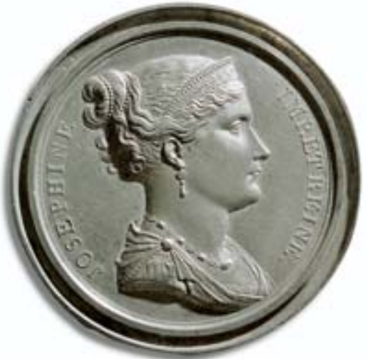
Einseitige Medaille um 1805 auf Napoleons erste Frau, Josephine de Beauharnais (*1763, † 1814) Napoleon heiratete 1796 die Witwe Josephine, sie wurde 1804 zur Kaiserin gekrönt. Er ließ 1809 die Ehe wegen Kinderlosigkeit annullieren und heiratete Marie Louise von Österreich.