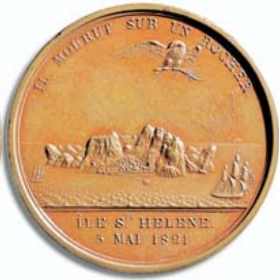
Medaille 1821 auf Napoleons Tod auf St. Helena

weit wie möglich – strahlt doch sein Ruhm auf sie zurück. Nur sein zweitältester Bruder Luciano hat sich dem Papst unterstellt. Besuchserlaubnis auf der einsamen Insel wird jedoch niemandem gewährt.