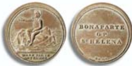
Napoleon auf St. Helena. „Wie soll ich hier wegkommen?“ Niederländische Spottmedaille 1815.

Asyl. Am 14. Juli 1815 verlässt er für immer Frankreich. Doch nur wirkliche und blaublütige Souveräne können auf ein Asyl im „Verwandtenkreis“ an einem europäischen Fürstenhof hoffen. Ein englisches Schiff bringt Napoleon mit 50 Getreuen in zwei Monaten Schiffsfahrt auf die entlegene Atlantikinsel St. Helena, 3.000 km von Brasilien und 2.000 km von Afrika entfernt, wo ihm unter ständiger Überwachung ein nochmaliges Entkommen wie von Elba oder seinerzeit aus Ägypten unmöglich ist. Empfangen wird er dort nicht mehr als Kaiser – die Engländer haben ihn nie als solchen anerkannt – sondern als „Staatsgefangener General Buonaparte“.