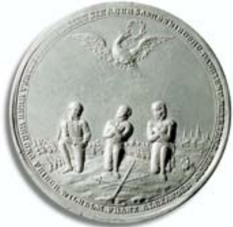
Medaille 1813 auf die Völkerschlacht bei Leipzig Die knienden Monarchen von Preußen, Österreich und Russland auf dem Schlachtfeld. „Und der Herr verlieh ihnen d. Sieg. Sie aber sanken nieder und dankten und beteten z. Herrn“.

er 1812 mit der Grande Armée nach Osten und kam nach Moskau, bis ihn der Winter, fehlender Nachschub und die russische Guerilla-Taktik zum Rückzug zwangen. Wieder verließ der Anführer seine Armee, die in Russlands Weiten elendig unterging.