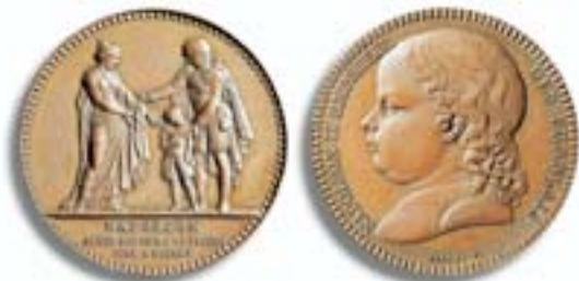
Medaille 1815, zweite Abdankung Napoleons und Einsetzung seines Sohnes als Napoleon II. Vs.: Napoleon übergibt seinen Sohn an Frankreich. Der Vierjährige auf dem Kaiserthron wurde von den Siegern über Napoleon nicht ernst genommen. Sie setzten Ludwig XVIII. wieder ein.

Napoleon zog sich mit den Resten seiner geschlagenen Truppen nach Paris zurück, um dort am 22. Juni 1815 zum zweiten und letzten Mal mit verwaschenem Namenszug seine Abdankung zu unterschreiben. Er setzt noch sein vierjähriges Söhnchen als Nachfolger ein, aber niemand nimmt dies ernst. Unter dem großmütigen und mäßigenden Bourbonenkönig Louis XVIII. wird die Monarchie wieder hergestellt, die erst 23 Jahre zuvor durch die Revolution gestürzt worden war.