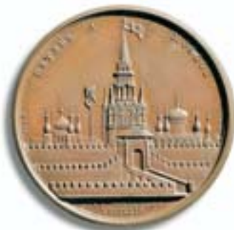
Napoleons Einzug in Moskau Medaille 1812.

In dieser Krise dankte Napoleon 1814 ab, er hoffte so irgendwie aus der Niederlage