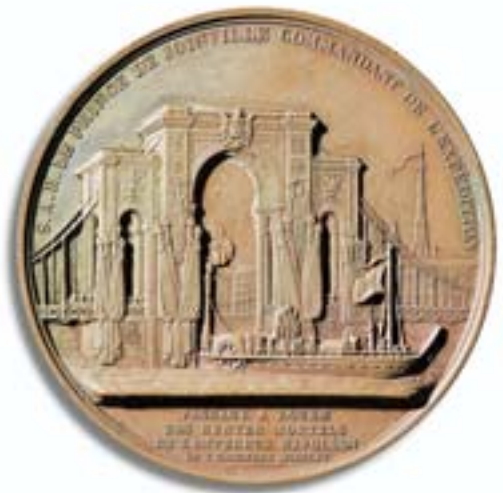
Überführung der Gebeine Napoleons nach Paris