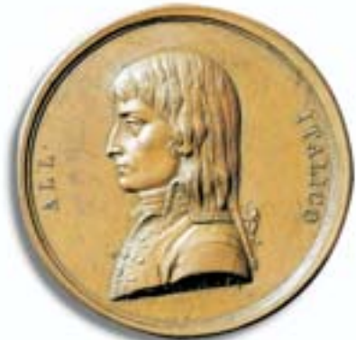
Revolution, 1789-1799 Medaille 1797 auf die Befreiung der Lombardei.

Als Ergebnis der Siege Napoleons verzichtete der habsburgische Kaiser Franz II., selbst in seinen Kernländern angegriffen, im Frieden von Campo Formio auf die Lombardei und das linke Rheinufer. Damit gehörte auch das bereits 1794 durch französische Revolutions-