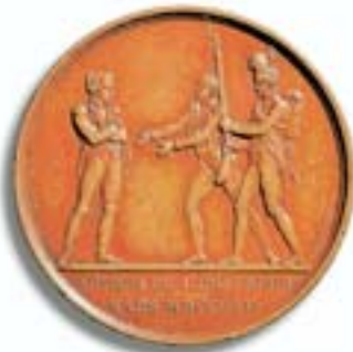
Marsch Napoleons auf Paris, Medaille 1815 Die inzwischen unter Ludwig XVIII. königlich gewordenen Truppen laufen zu Napoleon über.

Die alten Gegner schreckten auf, fanden wieder zusammen und rüsteten, während der abgesetzte Kaiser in Frankreich neue Truppen aushob und Anstalten traf, die Besatzer aus dem Land zu treiben. Die Übermacht der Gegner war jedoch zu groß und sein Land zu erschöpft. So lief alles auf die Schlacht von Waterloo hinaus, wo die erneute Koalition aus Engländern und Niederländern unter Wellington und Preußen unter Blücher dem Genie der Feldherrenkunst seine letzte, entscheidende Niederlage beibrachte. Die riesige russische und österreichische Armee unter Feldmarschall Schwarzenberg kam dabei gar nicht mehr zum Einsatz.